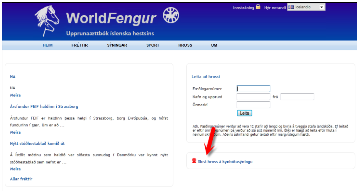
Mynd 1. Skrá hross í kynbótasýningu

Víkjum nú að skráningarkerfinu. Einfaldasta leiðin er að skrá í gegnum heimasíðu Worldfengs, www.worldfengur.com , (sjá mynd 1) en þar er hægt að smella á hnappinn Skrá hross á kynbótasýningu . Munið að hafa við hendina fæðingarnúmer hrossins og kennitölu knapa en það eru upplýsingar sem verða að koma fram.